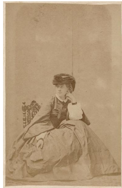
Portret van Alexine Tinne